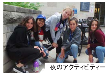
夜のアクティビティ