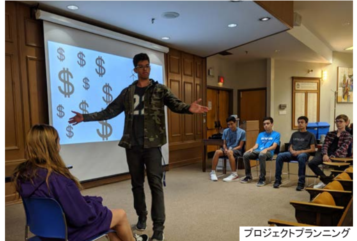
プロジェクトプランニング