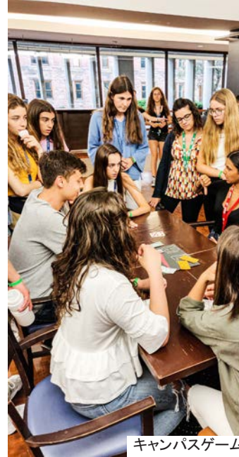
キャンパスゲーム