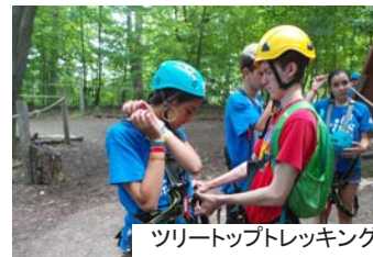
ツリートップトレッキング