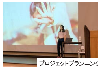
プロジェクトプランニング

「グローバルリーダーシッププログラムは、とても楽しかったです。新しいこともたくさん学べたし、クラスメイトとのグループワークも楽しかったし。とにかく素晴らしかったの一言ですね!」